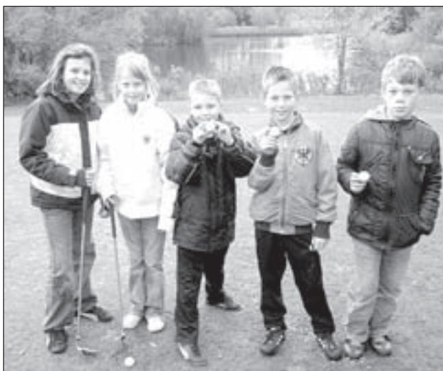
De kinderen vermaken zich goed op Golfbaan Spaarnwoude

- Kater gecastr, cypers rood, wit bandje om (Heemskerk) - Poes, zwart, witte bef, voorpoten witte tenen, achterpoten witte voetjes, korte staart, hapje uit rechteroor (Heemskerk) - Kat, zwart (Beverwijk) - Kater ongecastr, zwart, witte borst, buik, snuit en sokjes, mist punt van linkeroor (Beverwijk) - Kater ongecastr, zwart (Heemskerk) - Kater ongecastr, cypers grijs/zwart, witte snuit, bef en laarsjes (Velsen-Noord) - Poesje, zwart met wit (Limmen) - Poes, cypers grijs/zwart, witte vlek op kin (Beverwijk) Voor inlichtingen: Dierenambulante Kennemerland, tel. 0251-215454.