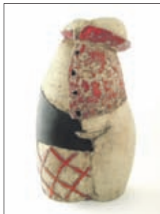
Dressed in Red, een beeld van deelnemer Joop Koopman uit Uitgeest.

hun trekken. De collectie omvat onder meer antiek huisraad, ambachtelijk gemaakt in velerlei stijlen, waaronder Art Deco, Jugendstil lampen, kristallen kroonluchters of olie- en koetslampen, Friese staartklokken, Engelse en schotse staande horloges, kristal en glas, porselein en aardewerk, tinnen, koperen en bronzen voorwerpen, lampen, oude kaarten, prenten en gravures, schilderijen, goud, zilver en edelstenen, verzamelvoorwerpen en curiosa. Op zaterdag is het mogelijk antiek en kunst gratis te laten taxeren. Op de Antiekade is informatie voorhanden over restauratie en onderhoud van antiek. Ook worden fraaie kunst- en antiekboeken aangeboden. Bij de stand van Palet Kunstmagazine ontvangt de bezoeker het magazine ter waarde van 6,75 euro geheel gratis. De openingstijden zijn vrijdag van 19.00 - 22.00 uur, zaterdag en zondag van 11.00 - 17.00 uur. Toegangsprijs 7,50 euro, CJP/65+ 6,00 euro. Kinderen tot zestien jaar onder begeleiding van volwassene gratis. Het adres is Kennemerstraatweg 425 in Heiloo. Kijk ook op www.antiekade.nl .