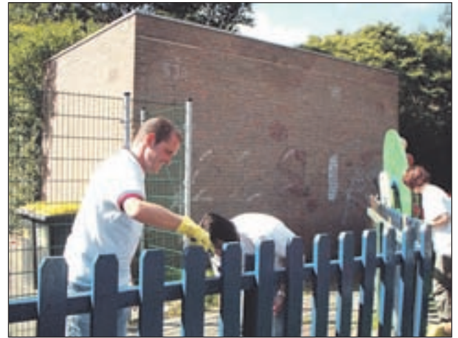
Het speeltuinhek schilderen

Tot ziens in de winkels aan de Breestraat 15 in Beverwijk of Maerelaan 5 in Heemskerk.