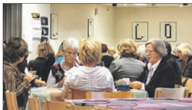
De gezellige kerstdrive van 2008

ken uit Wijk aan Zee. De rubberboot heeft ze op sleeptouw genomen en naar Wijk aan Zee teruggebracht. De reddingbrigade aldaar wachtte de rubberboot op bij de waterlijn om assistentie te verlenen. Na een bakje koffie voer de rubberboot weer richting Castricum, waar ze omstreeks 18.00 weer landde.